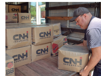
Doação de empresas

Sede do SMetal: Rua Júlio Hanser, 140 - Centro Clube dos Metalúrgicos: Av. Victor Andrew, 4100 - Éden Banco de Alimentos: R. Terêncio Costa Dias, 300 - Pq. Santa Isabel