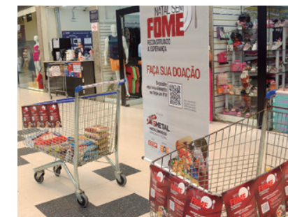
Doação em supermercados