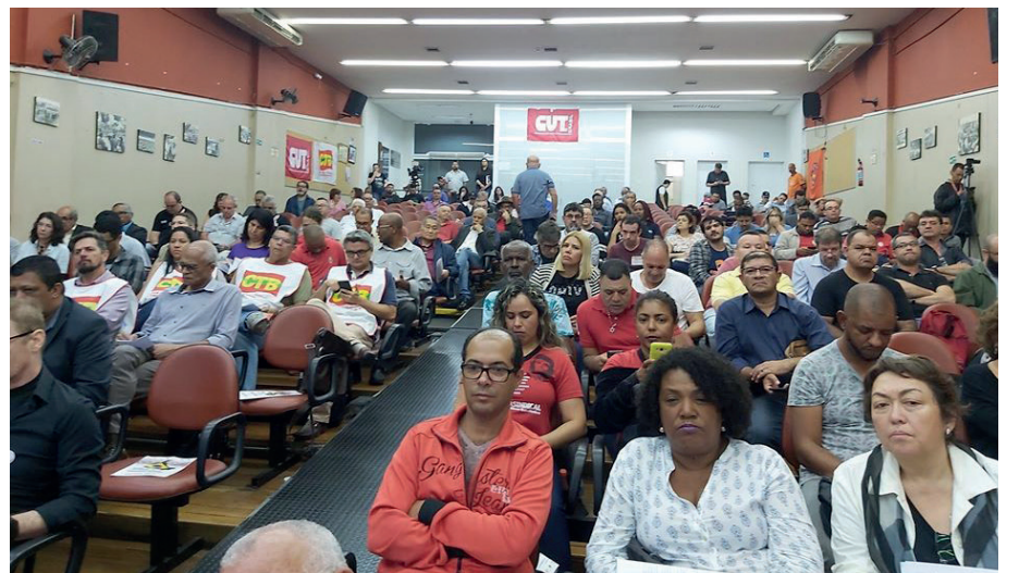
O encontro Emprego e Desenvolvimento das centrais sindicais e movimentos sociais ocorreu nesta segunda, 18, em São Paulo