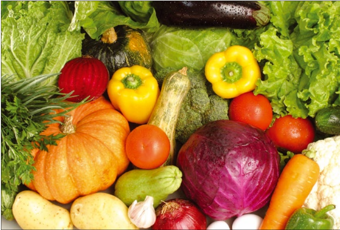
O Banco de Alimentos funciona na Ceagesp de Sorocaba e o Sindicato dos Metalúrgicos é um dos seus mantenedores

Em sete anos de existência, o Banco de Alimentos de Sorocaba já destinou mais de 3 mil toneladas de alimentos a entidades que atendem pessoas carentes ou em situação de vulnerabilidade social na cidade. Apenas em 2012, a ONG arrecadou 534 toneladas