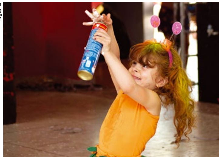
O clube dos metalúrgicos fica na avenida Victor Andrew, 4.100, Éden

Já as matinês, acontecem no domingo, dia 10, e na terça-feira, dia 12. A entrada, tanto nos bailes quanto nas matinês, será exclusiva e gratuita para sócios do Sindicato e dependentes. PÁG.4