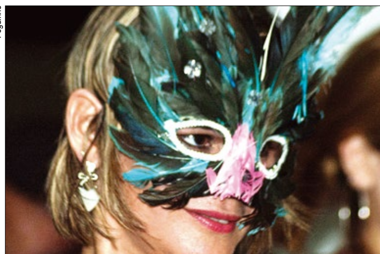
Os bailes acontecerão no sábado, dia 9 e na segunda, dia 11

em Ilha Comprida, funcionará normalmente, mas a ocupação é restrita aos sindicalizados sorteados em janeiro.