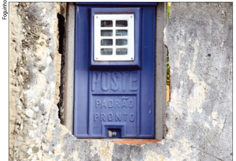
Medida assinada por Dilma Rousseff reduz conta de luz em residências e empresas

até 32% para as indústrias, agricultura, comércio e serviços. A medida favorece principalmente a indústria brasileira que poderá, com mais competitividade, contratar mais trabalhadores. PÁG.3