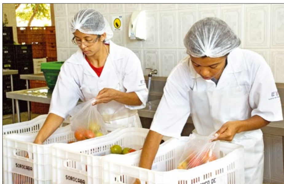
Distribuição de alimentos atende 20 mil pessoas todos os meses na cidade de Sorocaba

O “banco” funciona no pavilhão administrativo da Ceagesp, rua Terêncio Costa Dias, 300, Parque Santa Isabel. Tel. (15) 3417-4722.