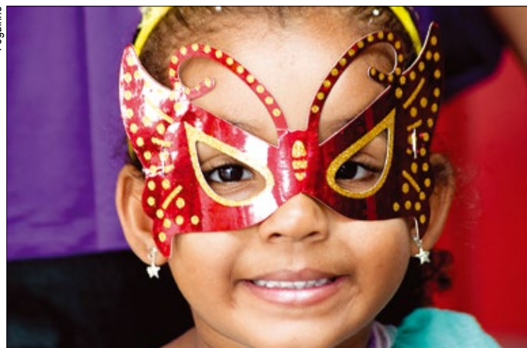
Já as matinês serão no domingo, dia 10, e terça, dia 12