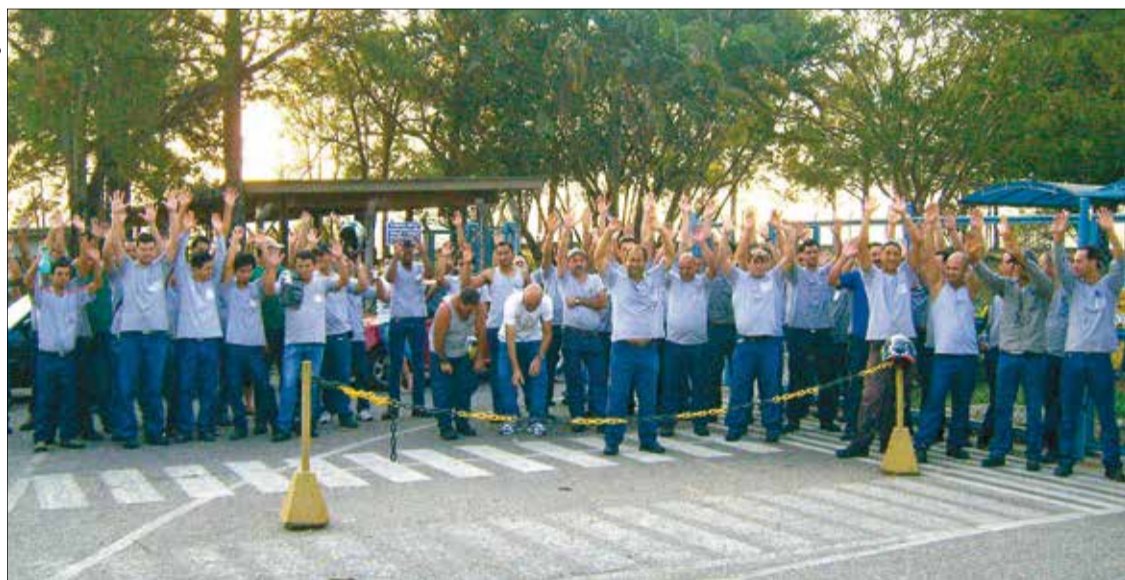
As negociações foram feitas entre empresa, sindicato e uma comissão formada por funcionários

Os trabalhadores da Metalac, fábrica de parafusos localizada em Sorocaba, aprovaram esta semana uma proposta de Programa de Participação nos Resultados (PPR) para este ano negociada entre a empresa, o Sindicato e uma comissão interna