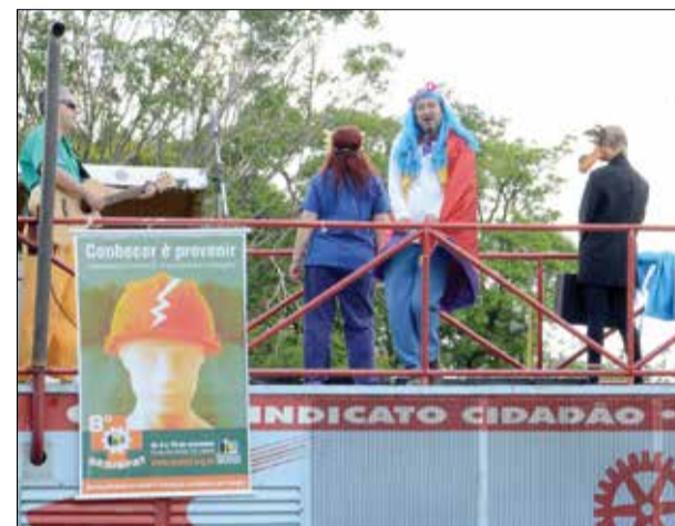
O grupo Teatro, Histórias e Canções se apresenta nas portas das fábricas

Na segunda-feira, dia 5, teve início a 8ª Semana Sindical de Prevenção a Acidentes de Trabalho (Sesispat), com apresentações teatrais em portas de fábricas.