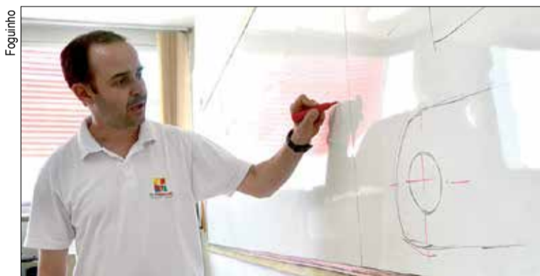
As aulas são realizadas na sede sindical em Sorocaba

A escola RH Treinare, parceria do Sindicato dos Metalúrgicos de Sorocaba e Região, está com inscrições abertas para as últimas turmas de 2012.