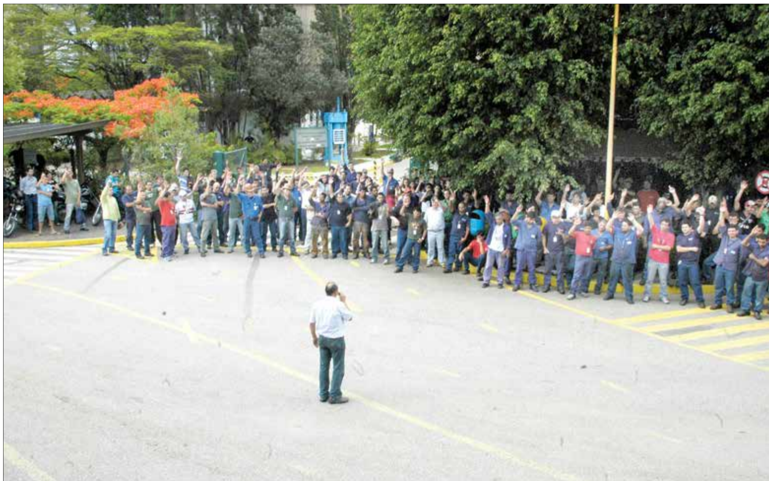
Os ajudantes tiveram reajuste de 17% além dos 8% da campanha salarial; acordo beneficia cerca de 10% dos funcionários da fundição

A Metso possui duas fábricas em Sorocaba, a Equipamentos e a Fundição que juntas empregam 1.700 funcionários. Na Fundição, onde houve o realinhamento salarial, trabalham 380.