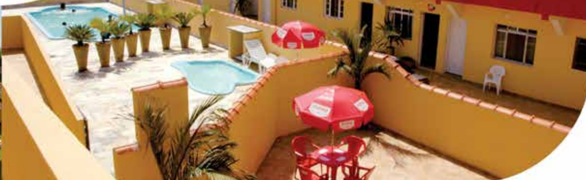
Foguinho / Arquivo SMetal