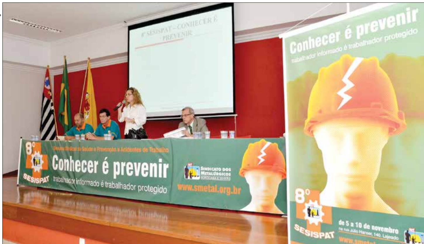
Abertura solene foi realizada na noite desta terça-feira, dia 6, e contou com palestra de representante do Ministério Público Estadual, advogada trabalhista e sindicalistas

A 8ª Semana Sindical de Saúde e Prevenção a Acidentes de Trabalho (Sesispat), promovida pelo Sindicato dos Metalúrgicos, começou na segunda-feira, com teatro em portas