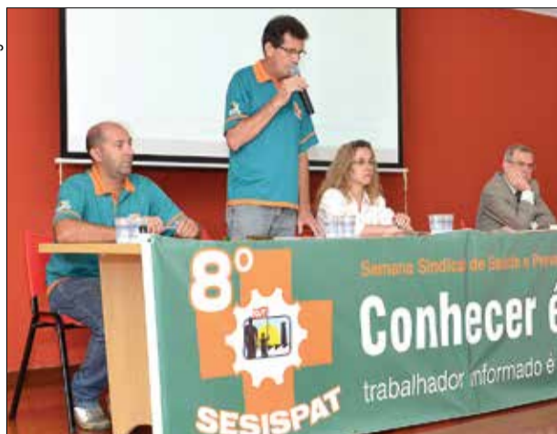
Solenidade de abertura foi realizada nesta terça, dia 6, na sede de Sorocaba