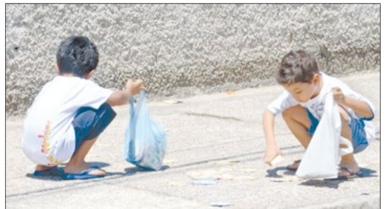
Crianças se divertem com materiais impressos de campanha

No último domingo, dia 7, o departamento de imprensa do Sindicato dos Metalúrgicos de Sorocaba e Região realizou cobertura especial das eleições municipais.