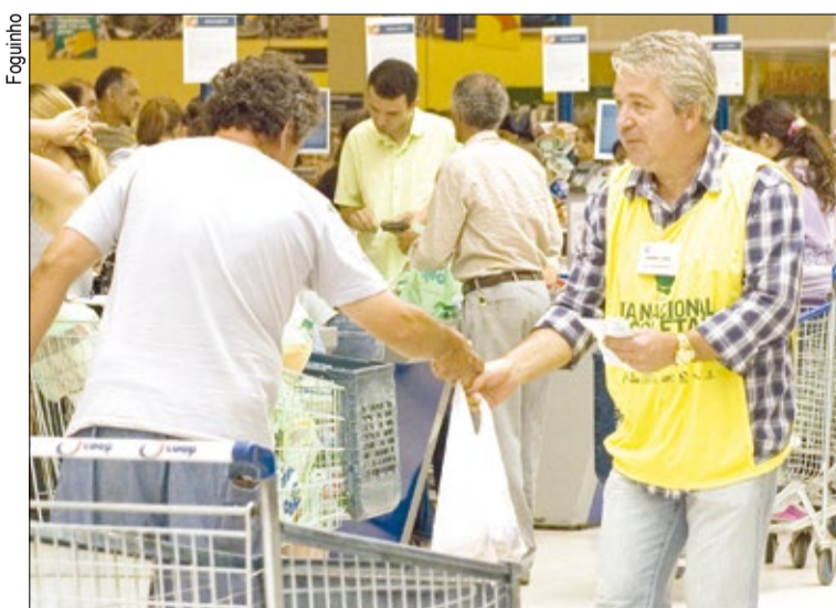
Voluntários poderão ajudar na abordagem dos clientes no supermercado

Em Sorocaba, a coleta será realizada com os supermercados parceiros da iniciativa Coop (Árvore Grande e Itavuvu) e Extra (Campolim e Santa Rosália). Os voluntários, previamente inscritos, poderão ajudar na abordagem dos clientes, no recebimento, pesagem e embalagem dos produtos doados.