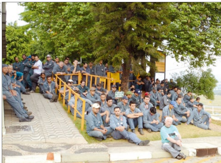
Na Bardella os trabalhadores também se mobilizaram para conquistar os 8% retroativos a setembro

Com apoio e mobilização dos trabalhadores, o Sindicato dos Metalúrgicos já garantiu reajuste salarial de 8% em 216 empresas da região, na qual trabalham 34.598 metalúrgicos, o que equivale a 75% do total de 46 mil trabalhadores da categoria.