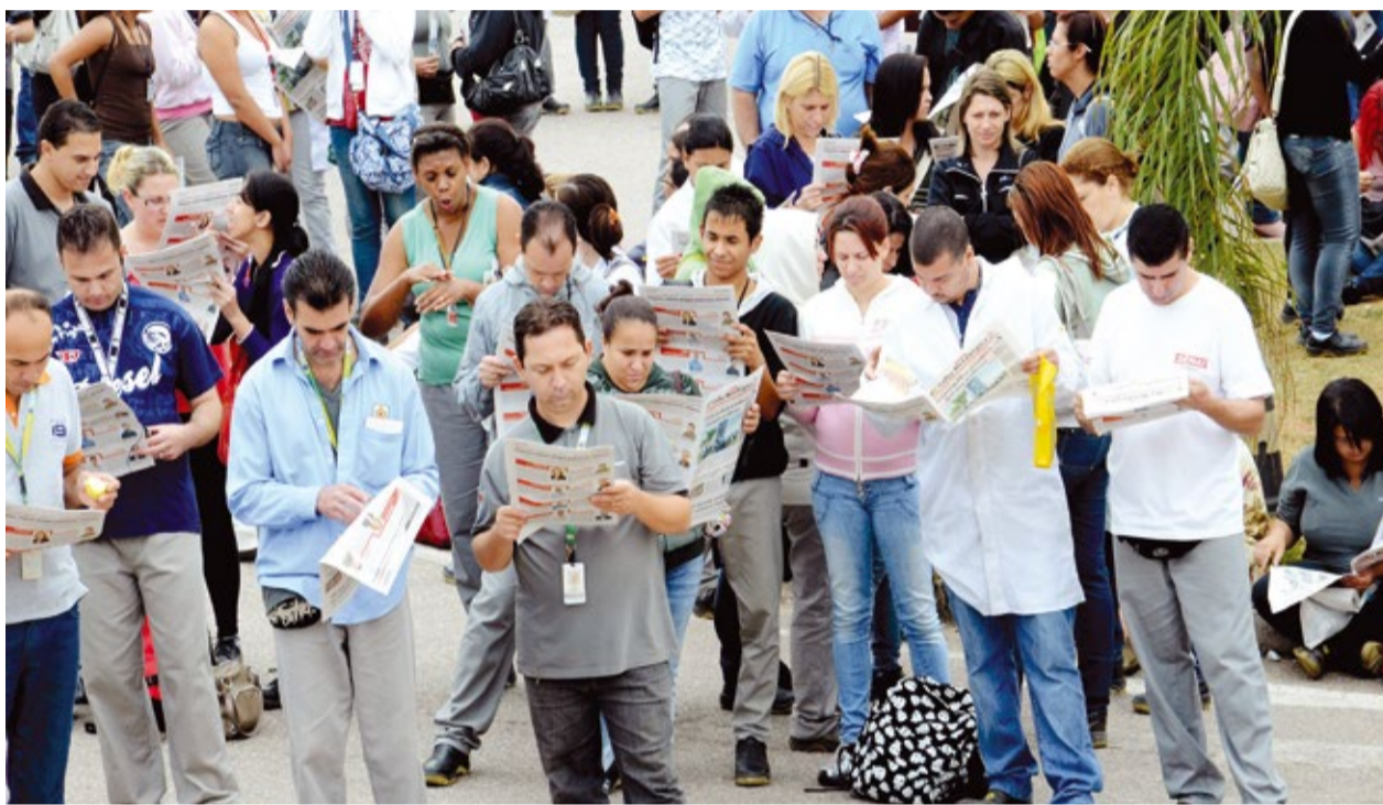
Metalúrgicos da Flextronics têm acompanhado passo-a-passo as negociações e vão votar proposta de PPR na segunda-feira

Já a reposição salarial de 8%, reivindicada pela Federação Estadual dos Metalúrgicos (FEM), foi garantida pela empresa a partir de outubro, com pagamento retroativo à data-base da categoria, que venceu no dia 1º de setembro.