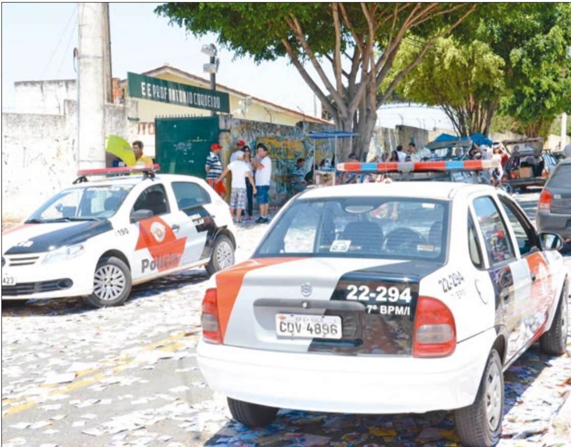
Movimento nos colégios eleitorais foi intenso, porém nenhuma ocorrência grave foi registrada em Sorocaba