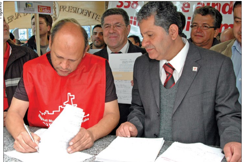
Projeto de iniciativa popular, com 26.584 assinaturas, foi protocolado em maio na Câmara

Diante da repercussão que teve a recente campanha pró-hospital municipal em Sorocaba, o prefeito Vitor Lippi (PSDB) agora reconhece a importância de se implantar o serviço de saúde na cidade. No último dia 6, a prefeitura pediu verbas ao governo do estado para ajudar na construção do hospital.