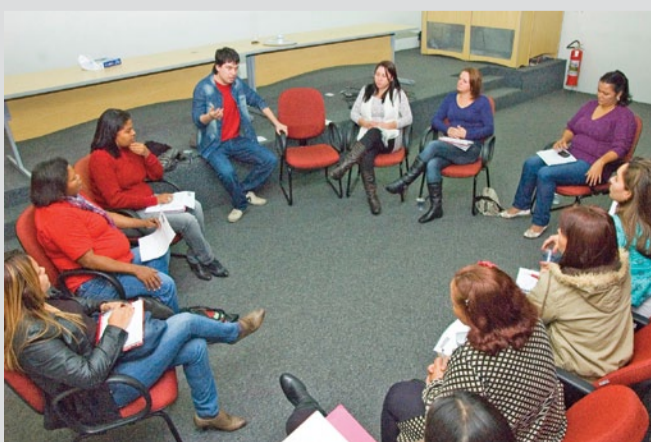
Sindicato foi sede da reunião da Secretaria de Mulheres da FEM/CUT

A data-base da categoria é 1º de setembro. As principais reivindicações da campanha salarial deste ano foram debatidas durante plenária nesta quarta-feira, 13, na sede da FEM, em São Bernardo do Campo (veja reportagem nesta edição).