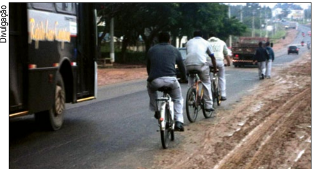
Risco de acidentes e trânsito caótico são alguns problemas no distrito

No último dia 22, o Sindicato promoveu um protesto no distrito industrial, com participação de trabalhadores e empresários, para chamar atenção do poder público sobre o mau estado de conservação das