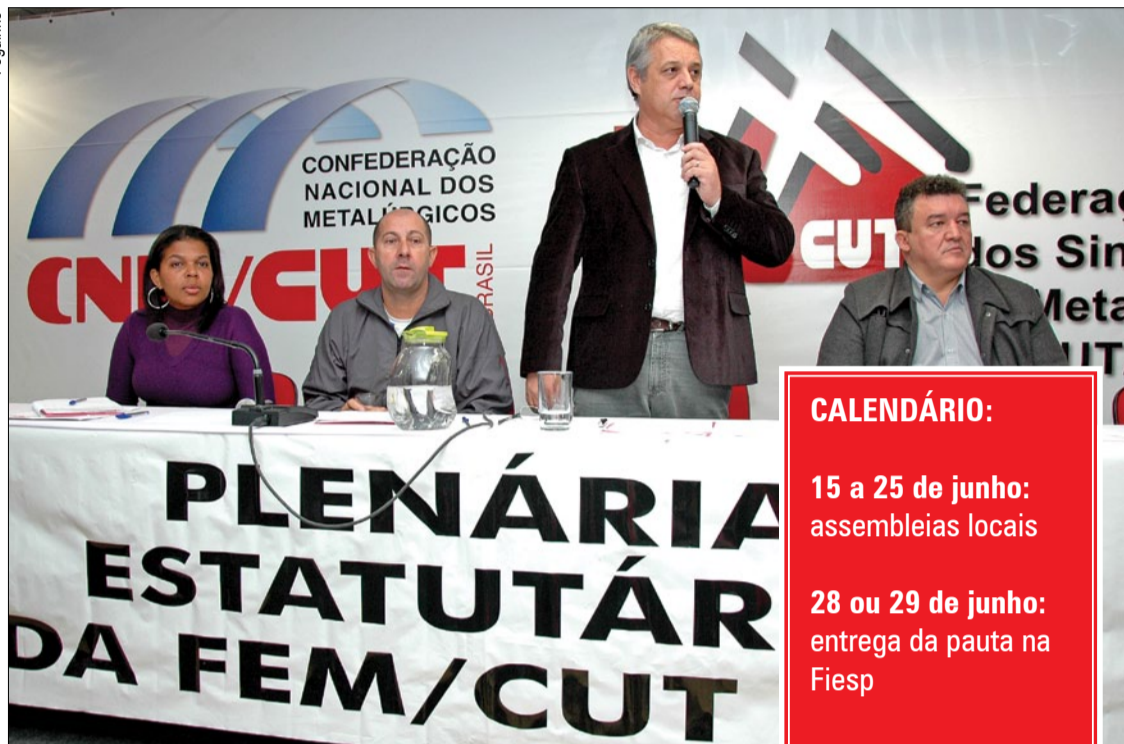
Eixos aprovados na plenária serão votados em assembleias nos sindicatos

“Novamente contamos com o engajamento de toda a categoria para que a campanha salarial deste ano seja novamente vitoriosa”, completa Ademilson Terto.