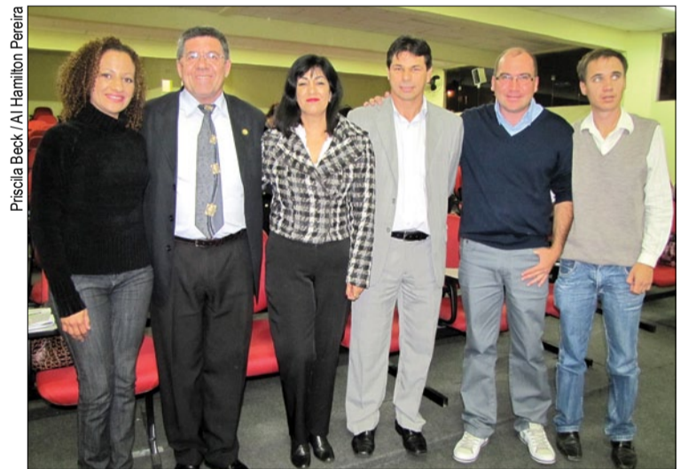
Evento em Piedade reuniu representantes de associações e lideranças políticas