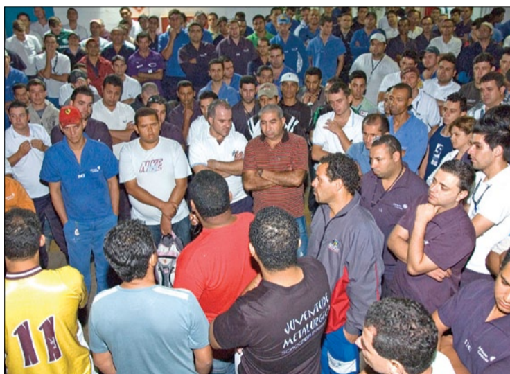
Mobilização dos trabalhadores da Johnson foi essencial para a conquista

As negociações e mobilizações sobre programas de participação nos resultados (PPR) de 2012 continuam em dezenas de outras fábricas da categoria.