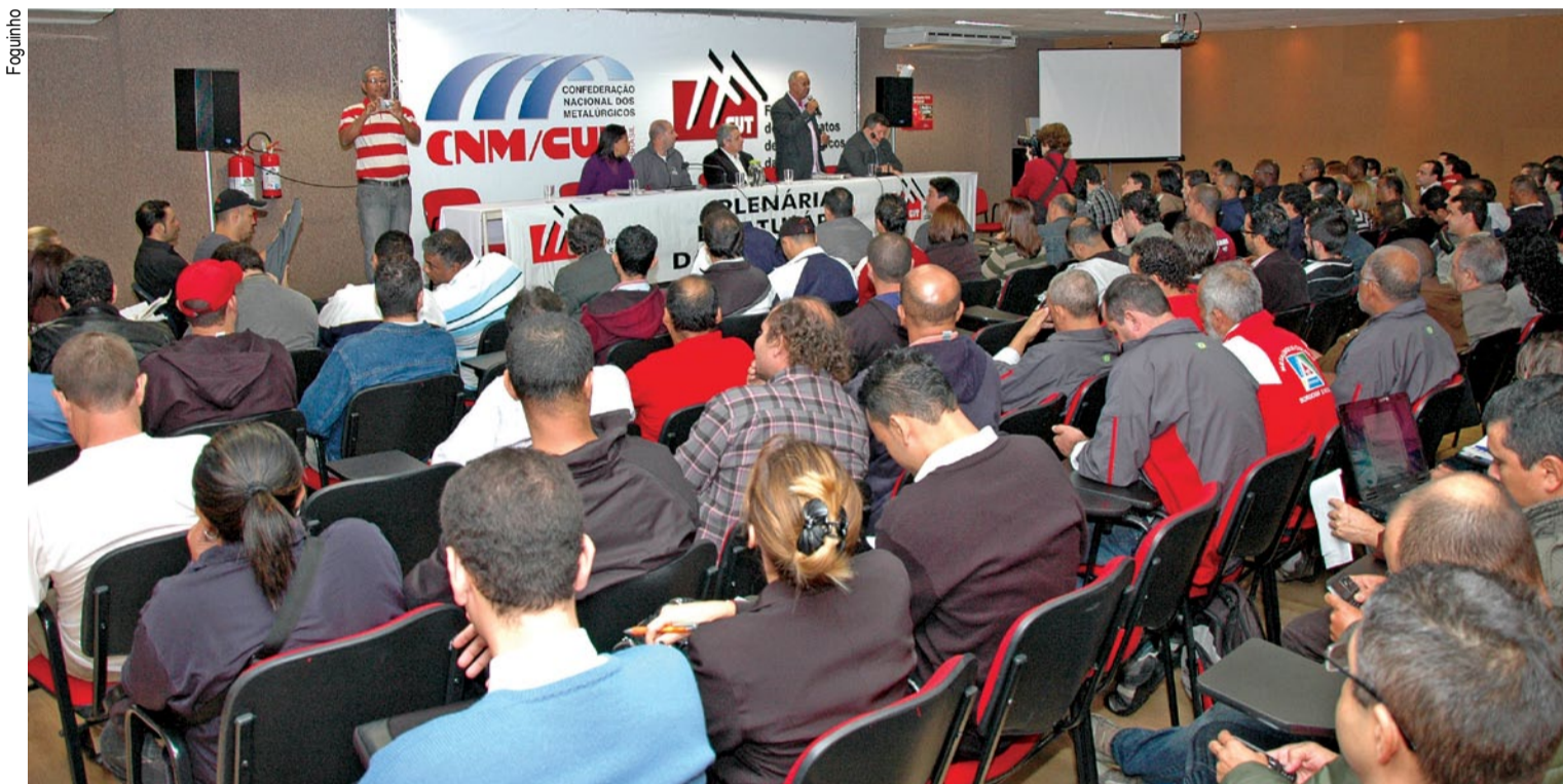
Plenária da Federação teve participação de dirigentes sindicais de diversas regiões do estado, onde os sindicatos são filiados à CUT