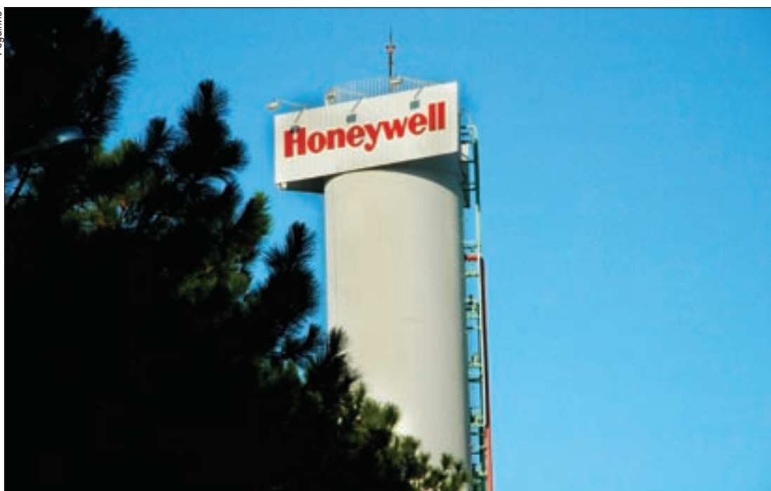
Honeywell, antiga Jurid, fabricante de autopeças, teve dois acidentes de trabalho no mês de maio

Somente em maio dois trabalhadores se acidentaram na fábrica