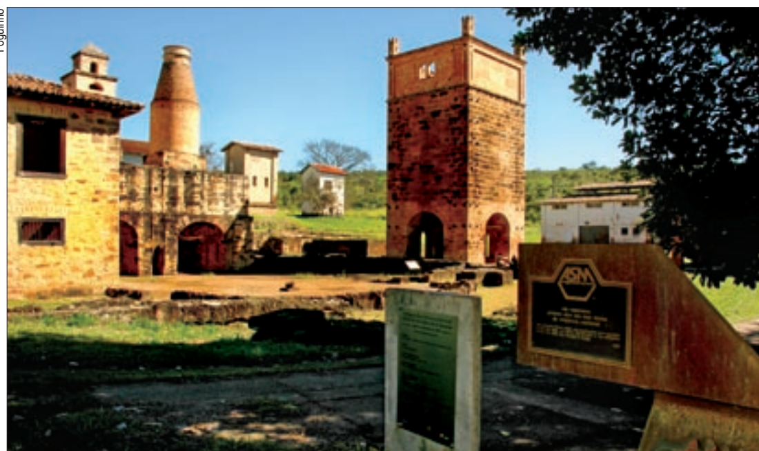
Altos fornos do século 19 (foto) e ruínas de fundições do século 16 foram visitadas por metalúrgicos

Por volta de 1590, os bandeirantes Afonso Sardinha (pai e filho) instalaram um forno rústico no local