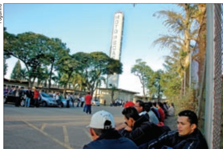
Melhoras na Moto Peças só virão com união de todos os trabalhadores

A Moto Peças emprega 328 trabalhadores. A primeira parcela do PPR, de R$ 600, será paga dia 15 deste mês.