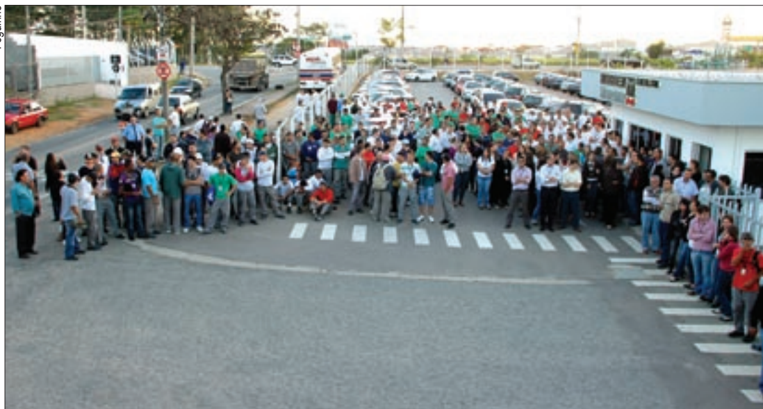
Unidos, trabalhadores da Wobben rejeitam proposta de PPR apresentada pela fábrica

Além da Case (matéria nesta página), também os trabalhadores da Wobben, fabricante de equipamentos para energia eólica, instalada na zona industrial de Sorocaba, rejeitaram proposta