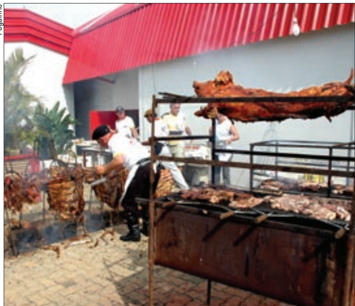
Integrantes do Centro de Tradições Gaúchas (CTG) prepararam o churrasco

O Banco de Alimentos de Sorocaba arrecadou R$ 3.045 com o almoço [churrasco fogo de chão] promovido pelo Sindicato dos Metalúrgicos no último dia 16 de maio. Realizado na sede do clube de campo da categoria, no Éden, o churrasco reuniu 330 pessoas e contou com a colaboração de integrantes do CTG Fronteira Aberta, o Centro de Tradições Gaúchas em Sorocaba.