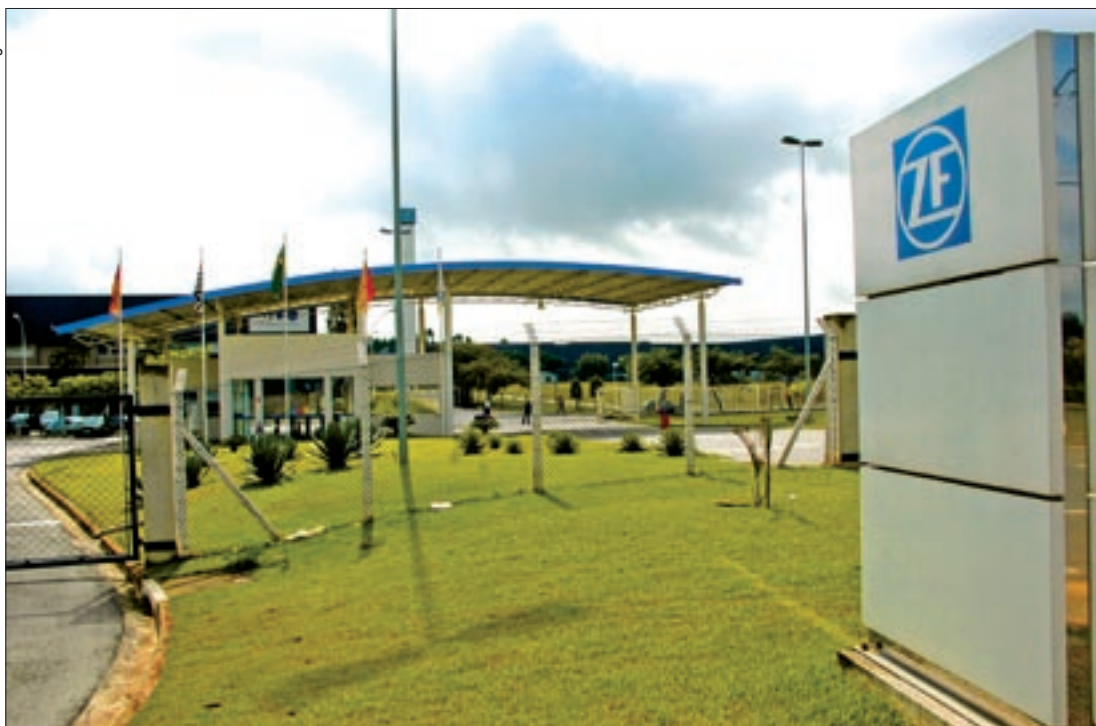
Metalúrgicos da ZF, preocupados com o risco coletivo, denunciaram que não havia médico na hora do acidente