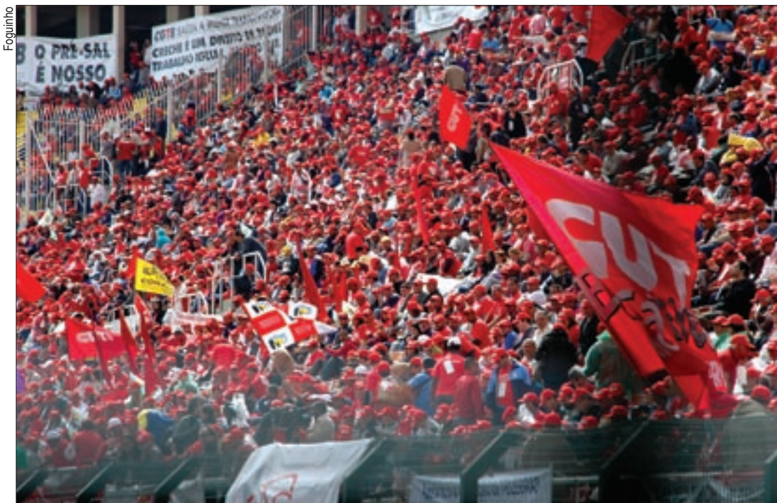
O encontro foi realizado no estádio do Pacaembu em São Paulo e reuniu mais de 22 mil trabalhadores de todo o país

O documento, aprovado pelas centrais, será entregue a todos os candidatos à Presidência da República este ano.