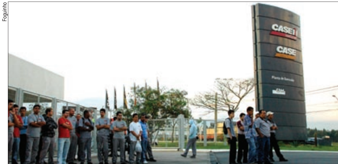
Empresa antecipou primeira parcela, mas união dos trabalhadores será fundamental para o valor da segunda

A Case é uma empresa do grupo CNH e produz máquinas agrícolas e para construção civil. Em Sorocaba ela possui uma unidade de produção e um centro de distribuição, ambas na mesma área, na zona industrial da cidade. Foi reinaugurada na cidade em março deste ano e emprega 450 trabalhadores, aproximadamente.