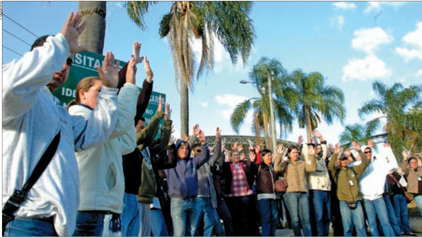
Trabalhadores da Ecil aprovam PPR 2010; empresa tem duas unidades em Piedade; negociações evoluem também em outras metalúrgicas da região

Os trabalhadores da Ecil, em Piedade, aprovaram, em assembléia dia 2, uma proposta que representa um PPR até 5,8 vezes (ou 481,37%) maior do que o do ano passado. Trabalhadores que receberam R$ 263 de PPR em 2009 devem receber R$ 1.529 este ano.