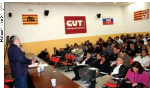
Plenária da FEM que aprovou pauta nesta terça, em Taubaté

As reivindicações prioritárias serão: 1) Reajuste salarial pelo índice total da inflação; 2) Aumento real nos salários; 3) Valorização dos pisos salariais; 4) Jornada de 40 horas semanais, sem redução nos salários e 5)